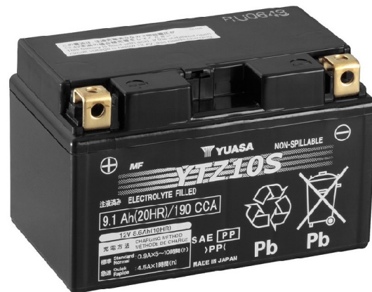
For Illustration Purposes Only