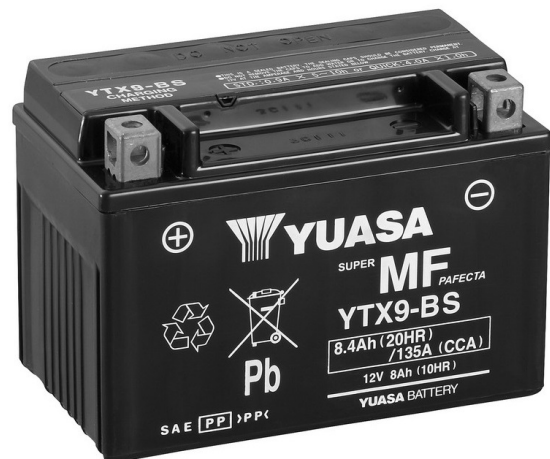
For Illustration Purposes Only